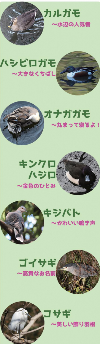
カルガモ ～水辺の人気者 ハシビロガモ ～大きくくちばし オナガガモ ～丸まって寝るよ！ キンクロハジロ ～金色のひとみ キジバト ～かわいい鳴き声 ゴイサギ ～高貴なお名前 コサギ ～美しい飾り羽根