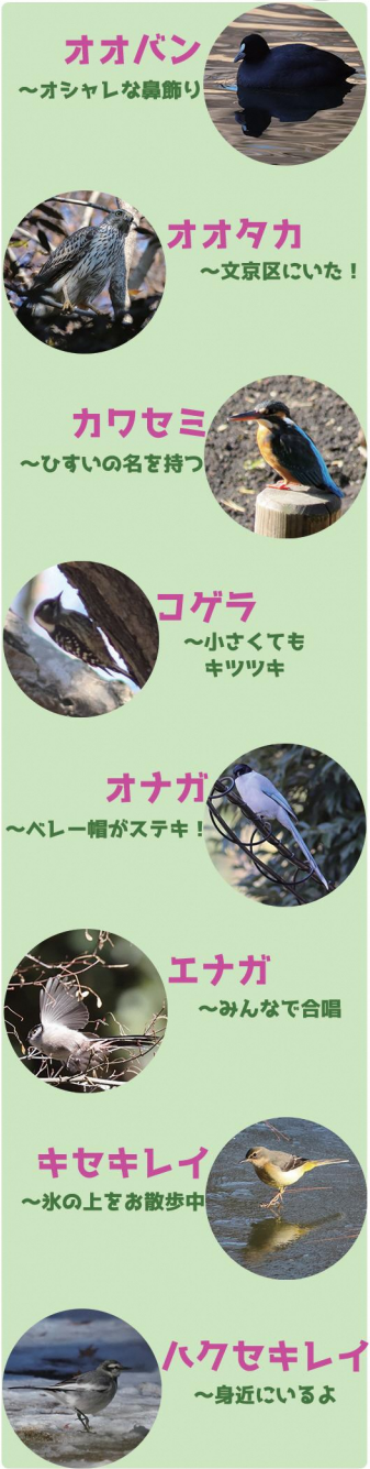
オオバン ～オシャレな鼻飾り オオタカ ～文京区にいた！ カワセミ ～ひすいの名を持つ コゲラ ～小さくてもキツツキ オナガ ～ベレー帽がステキ！ エナガ ～みんなで合唱 キセキレイ ～氷の上をお散歩中 ハクセキレイ ～身近にいるよ

G 種 G：その他の場所 (文京区内) オナガ シジウカラ ヒヨドリ メジロ ムクドリ ユグミ スズメ ハクセキレイ カワラヒワ